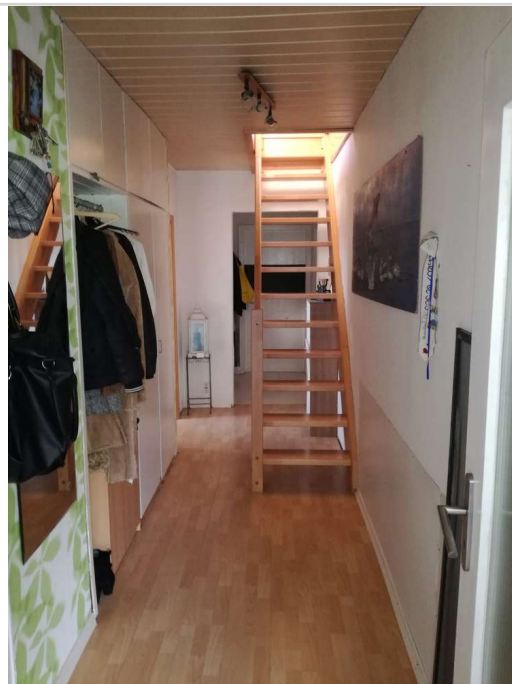
Treppe vom OG ins DG